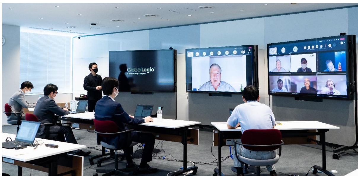
「Lumada Innovation Hub Tokyo」と GlobalLogic 社のデザインスタジオを接続したワークショップの様子

株式会社日立製作所(以下、日立)と米国子会社である GlobalLogic Inc.* 1 (以下、GlobalLogic 社)は、日本市場におけるデジタルトランスフォーメーション(以下、DX)サービスを推進するための協創を開始しました。この協創の取り組みは、日立の協創拠点「Lumada Innovation Hub Tokyo* 2 」を活用し、GlobalLogic 社と Lumada のケイパビリティを融合したものです。本取り組みは、両社の統合戦略に基づき、GlobalLogic 社の速やかな日本市場参入を実現するものです。